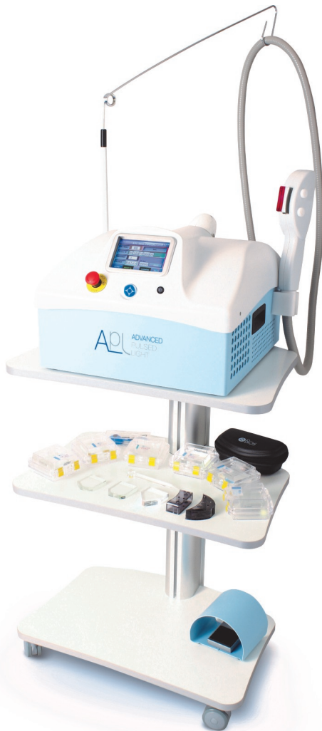
APL MED AUF GERÄTEWAGEN