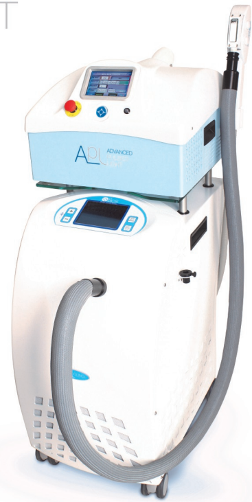
APL MED AUF CRYOSYSTEM BIOCOOLING AIR